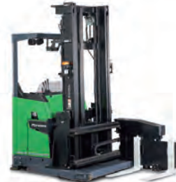
RinoVA RACK STOCKER