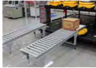
コンベヤシュート