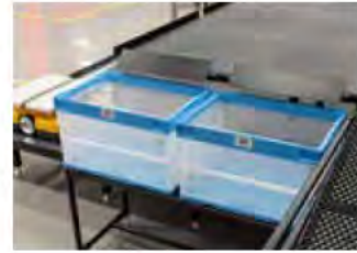
ダイレクトシュート