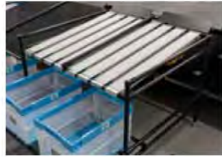
ローラーシュート